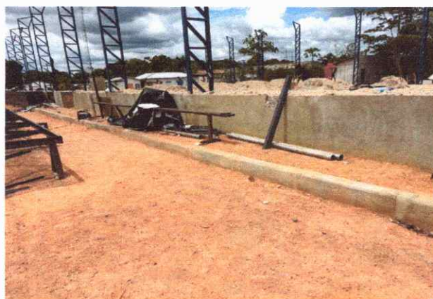
CALÇADAS EXECUÇÃO DE PASSEIO