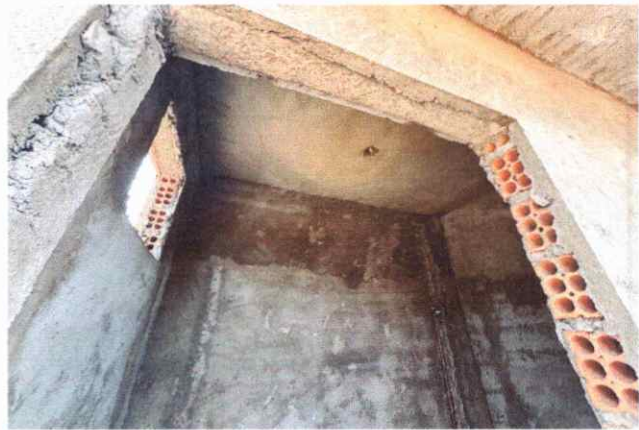
BANHEIROS EXECUÇÃO DE ALVENARIA