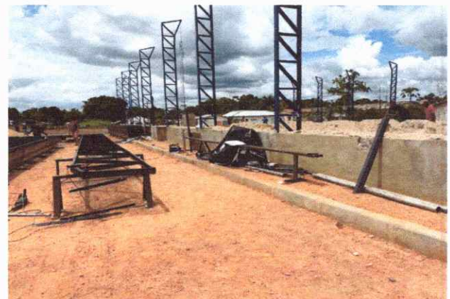
CALÇADAS EXECUÇÃO DE PASSEIO