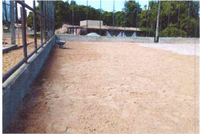
CALÇADAS EXECUÇÃO DE PASSEIO