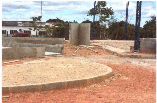
CALÇADAS EXECUÇÃO DE PASSEIO