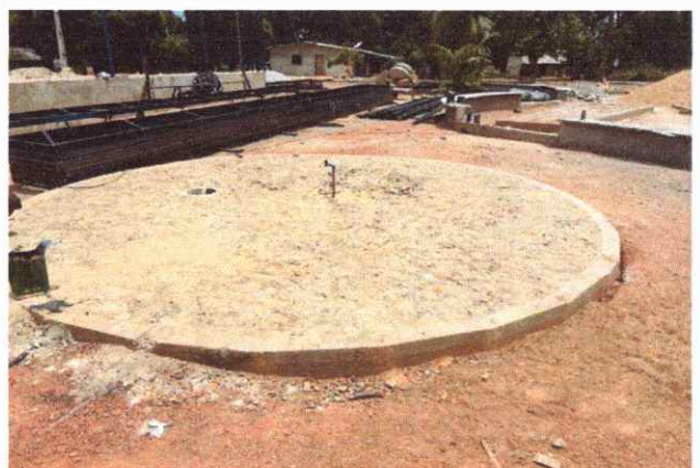
CALÇADAS EXECUÇÃO DE PASSEIO