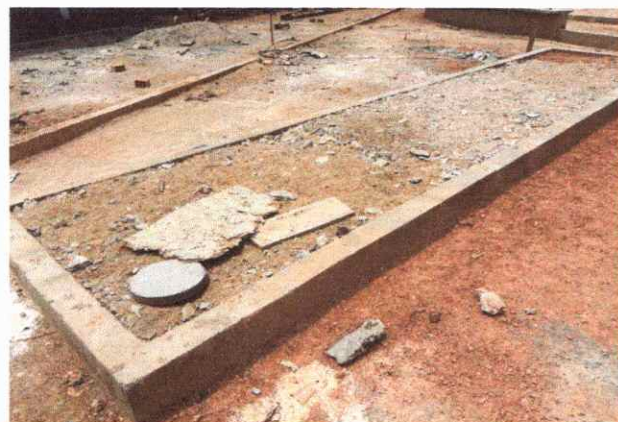
CALÇADAS EXECUÇÃO DE PASSEIO