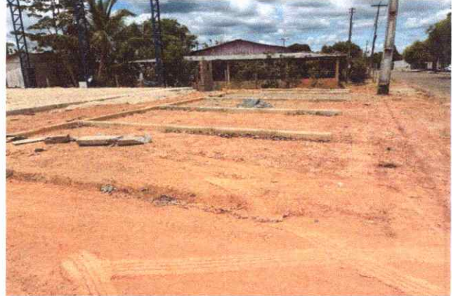
CALÇADAS EXECUÇÃO DE PASSEIO