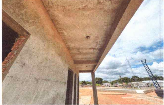
BANHEIROS INSTALAÇÕES HIDROSANITÁRIAS