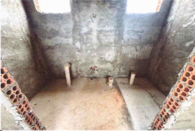
BANHEIROS INSTALAÇÕES HIDROSANITÁRIAS