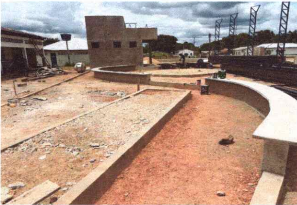
CALÇADAS EXECUÇÃO DE PASSEIO