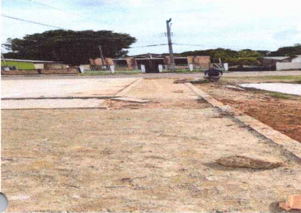
CALÇADAS EXECUÇÃO DE PASSEIO