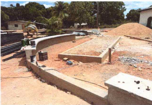
CALÇADAS EXECUÇÃO DE PASSEIO