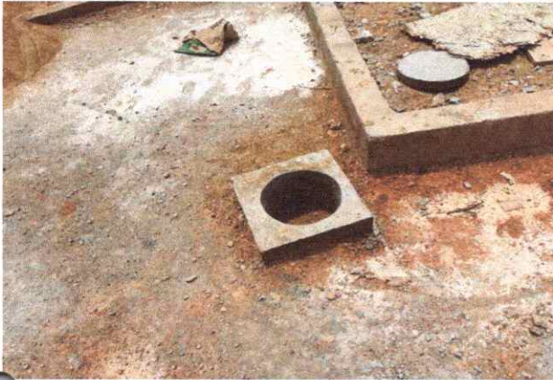
CALÇADAS EXECUÇÃO DE PASSEIO