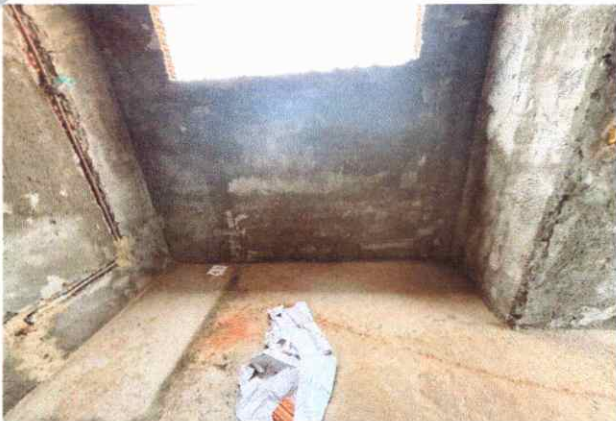
BANHEIROS EXECUÇÃO DE ALVENARIA