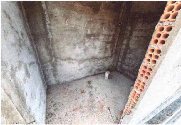
BANHEIROS INSTALAÇÕES HIDROSANITÁRIAS