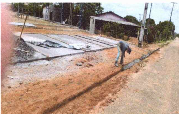
CALÇADAS PISO EM CONCRETO