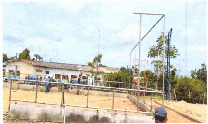
QUADRA DE AREIA MONTANTE PARA ALAMBRADO