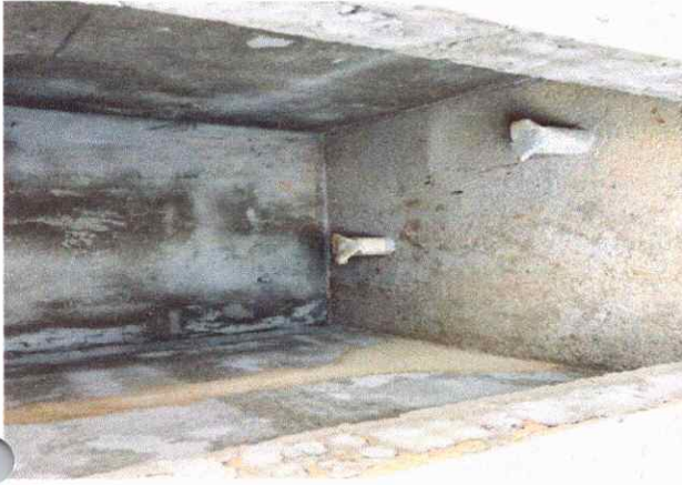
BANHEIROS/VESTIÁRIO EMBOÇO, PARA RECEBIMENTO DE CERÂMICA