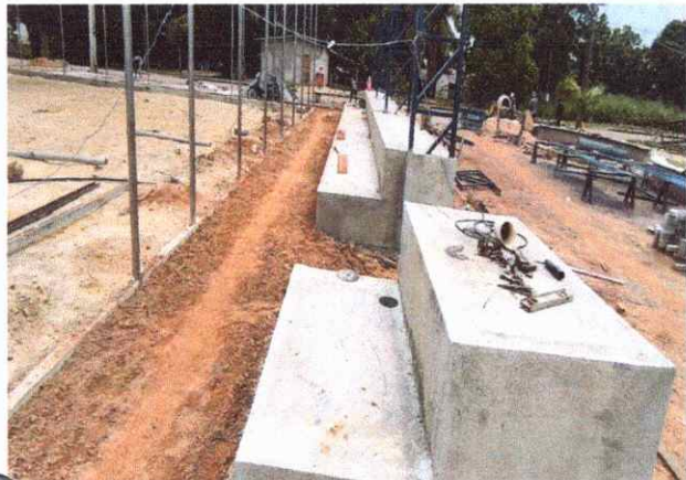
CALÇADAS ATERRO MANUAL DE VALAS COM SOLO ARGILLO