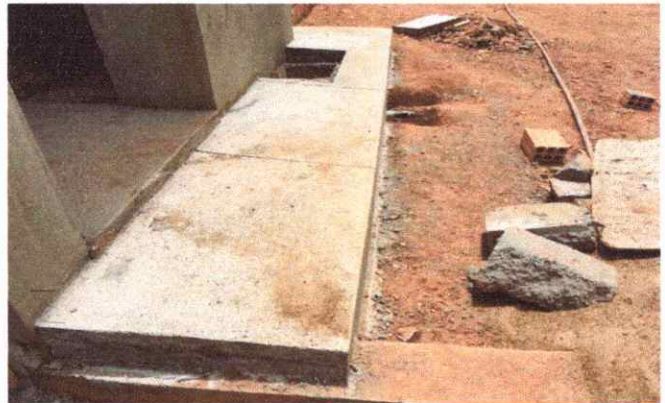
BANHEIROS/VESTIÁRIO PISO EM CONCRETO E PAVER