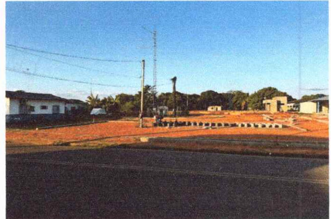
CALÇADAS ASSENTAEMNTO DE MEIO FIO