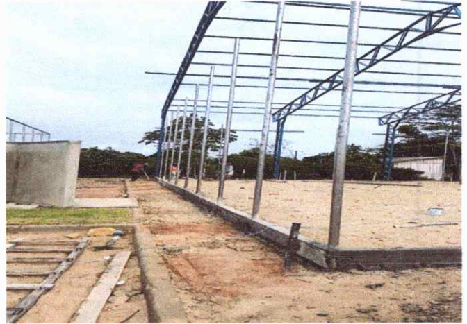
QUADRA POLIESPORTIVA MONTANTE PARA ALAMBRADO