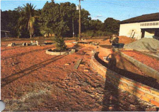
CALÇADAS ASSENTAEMNTO DE MEIO FIO