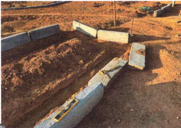
CALÇADAS ASSENTAEMNTO DE MEIO FIO