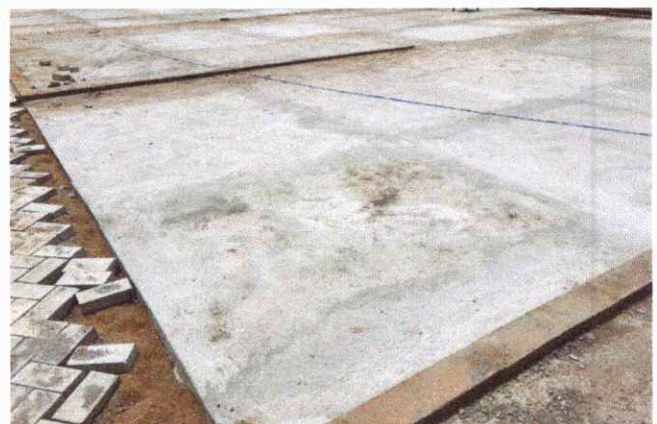
ESTACIONAMENTO PISO EM CONCRETO E PAVER