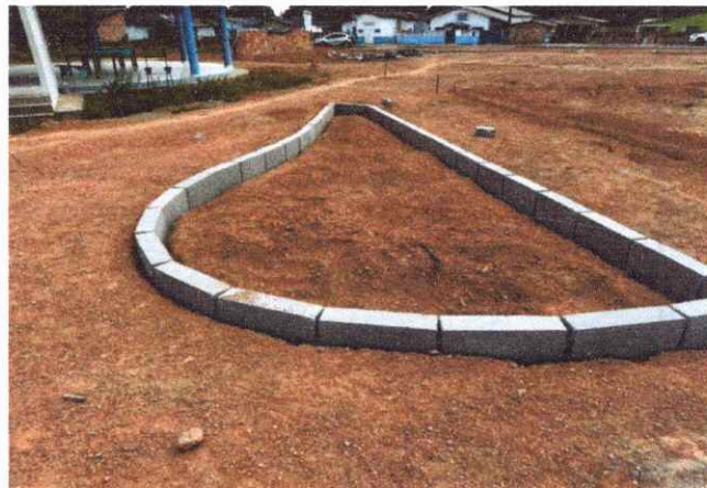
CALÇADAS ASSENTAEMNT0 DE MEIO FIO