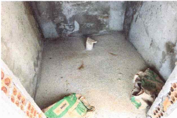
BANHEIROS/VESTIÁRIO EMBOÇO, PARA RECEBIMENTO DE CERÂMICA