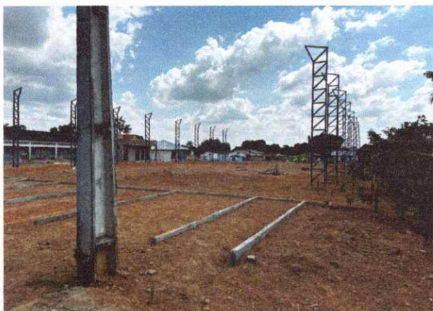
CALÇADAS ASSENTAEMNTO DE MEIO FIO