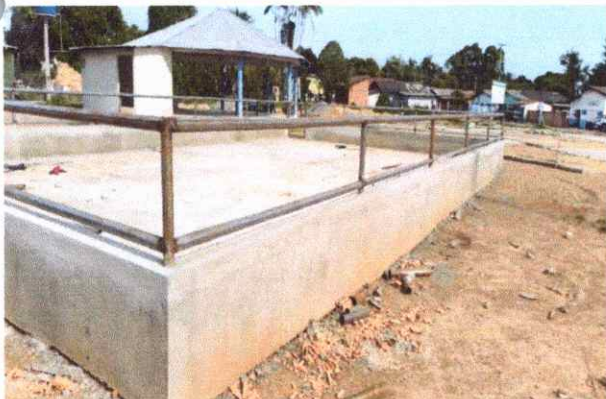
PLAYGROUD MONTANTE PARA ALAMBRADO