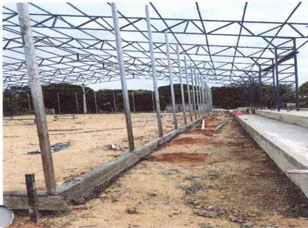
QUADRA POLIESPORTIVA MONTANTE PARA ALAMBRADO