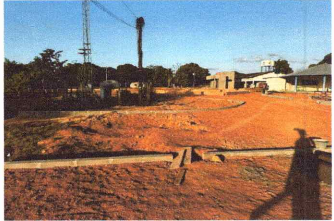
CALÇADAS ASSENTAEMNTO DE MEIO FIO