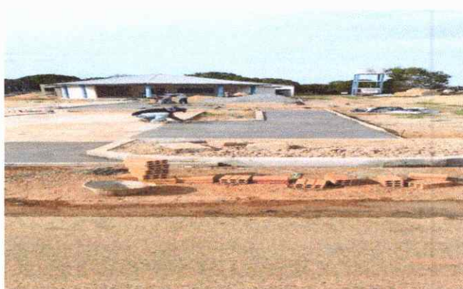
CALÇADAS PISO EM CONCRETO