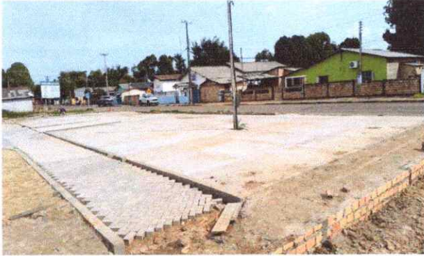
ESTACIONAMENTO PISO EM CONCRETO E PAVER