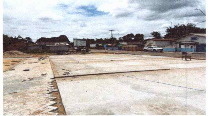
ESTACIONAMENTO PISO EM CONCRETO E PAVER