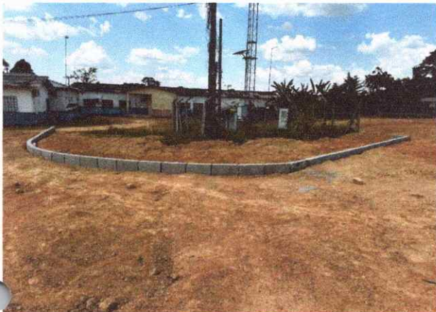
CALÇADAS ASSENTAEMNT0 DE MEIO FIO