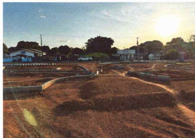
CALÇADAS ASSENTAMENTO DE MEIO FIO