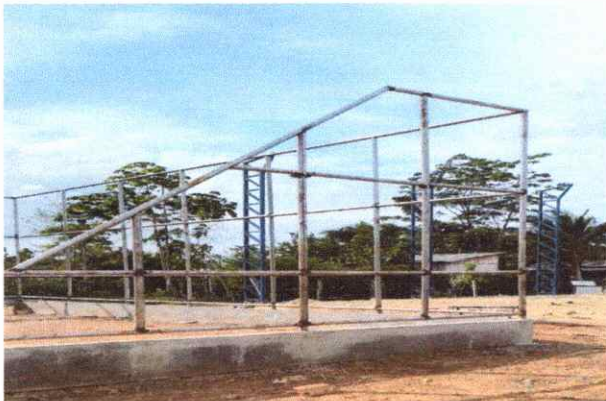
QUADRA DE AREIA MONTANTE PARA ALAMBRADO