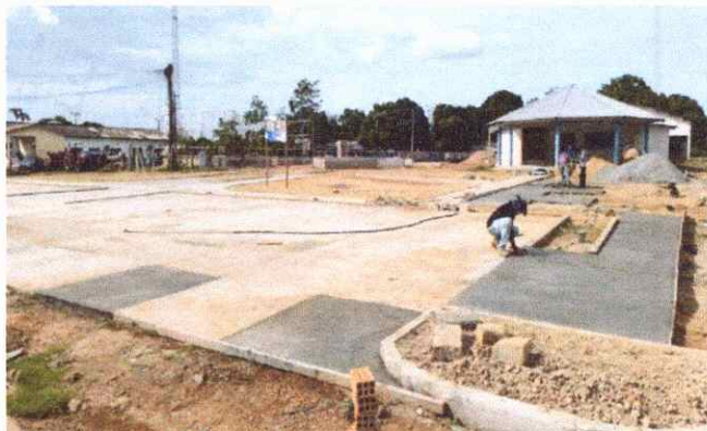
CALÇADAS PISO EM CONCRETO