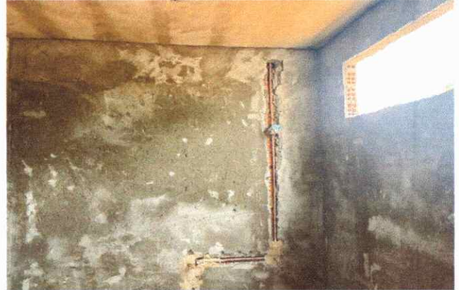
BANHEIROS/VESTIÁRIO EMBOÇO, PARA RECEBIMENTO DE CERÂMICA