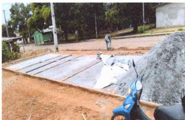
CALÇADAS PISO EM CONCRETO