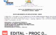
EDITAL - PROC 0...