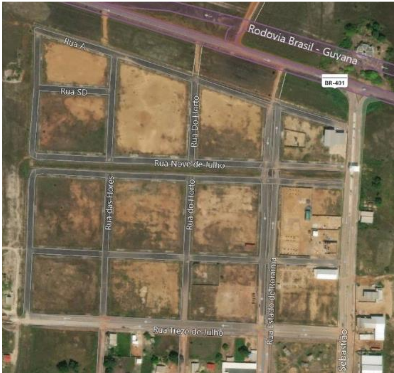
FOTO- ÁREA DESTINADAS A LOJAS FREE SHOP- MUNICIPIO BONFIM-RR

Leilão n° 001/2024 Processo Administrativo 122/2024